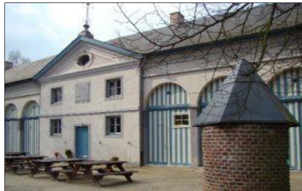
Domein Roosendael, Sint-Katelijne-Waver