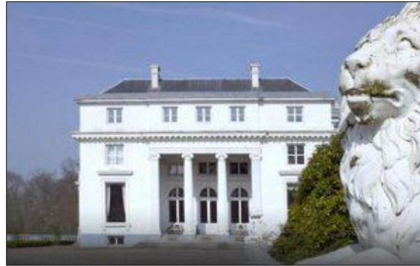
Hof ter Linden, Edegem